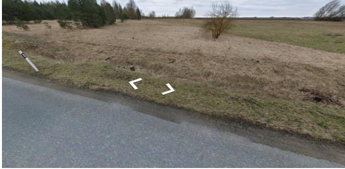
Joonis 1. Orienteeruv ristumiskoha asukoht km 2,52- 2,53

antud enne kinnistul mistahes ehitusloa kohustusliku hoone ehitamise alustamise teatise esitamist huvitatud isikule.